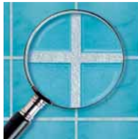
Spárovací hmota Ceresit s recepturou MicroProtect