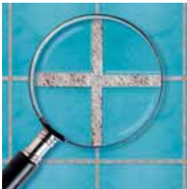
Běžná spárovací hmota

Spáry zůstanou čisté a krásné na opravdu dlouhou dobu!